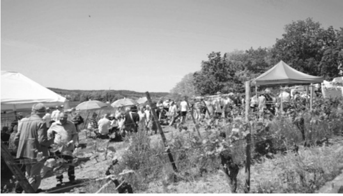
Bim Wine & Gin Walk präsentieren regionale Winzer und Edelbrennereien ihre Produkte inmitten der Angelbachtaler Weinberge.