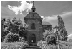
Die auf einem kleinen Hügel thronende Klosterkirche St. Maria, das ehemalige Klostergut, der Heil- und Kräutergarten und der Vorplatz sind wahre Schmuckstücke und formen ein harmonisches Gesamtbild.