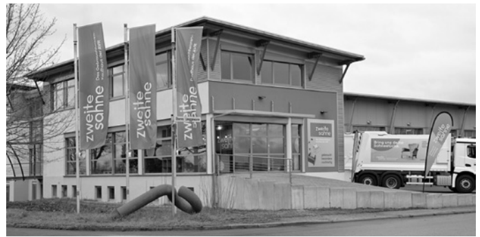
Gut erhaltene Gegenstände können in der „zweiten sahne“ in Dossenheim sowie auf den AVR Anlagen abgegeben werden. In der „zweiten sahne zwo“ in Eberbach ist keine Annahme von Gebrauchtwaren möglich.

Gerade beim Frühjahrsputz gilt daher: Weitergeben statt wegwerfen – und so ganz einfach etwas Gutes für die Umwelt tun.